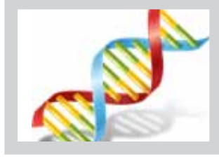
التاريخ المرضي العائلي